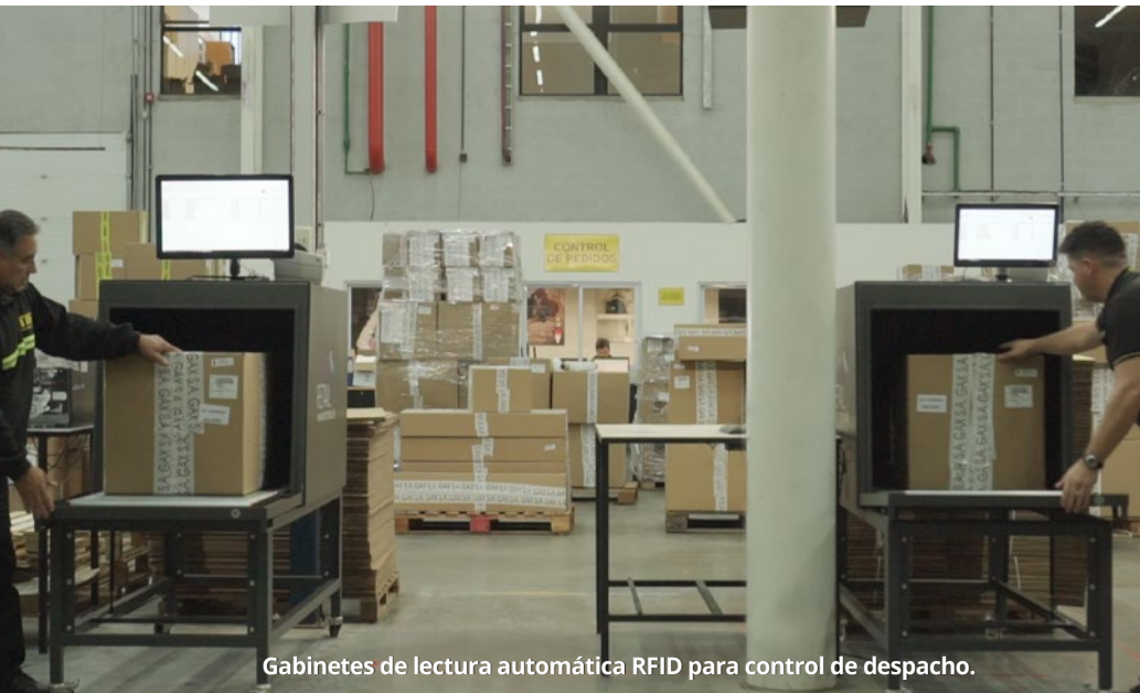
Gabinets de lectura automática RFID para control de despacho.

Paralelamente, se implementaron sistemas de impresión en la fábrica de Prüne en Argentina con el objetivo de realizar la identificación de aquellos productos que se manufacturan localmente.