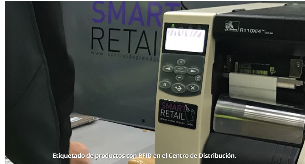
Etiquetado de productos con RFID en el Centro de Distribución.

En el Centro de Distribución se instalaron sistemas de lectura automáticos para realizar el control de recepción de mercadería de proveedores y el control de despacho de productos a las tiendas.